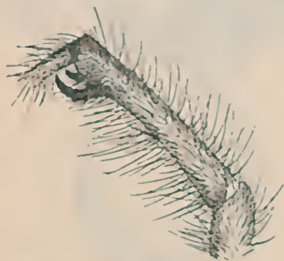
Fig. 7 Butantania hirsuta , g. n., sp. n. Tibia anterior do ♂

no terço basilar e dois apiculares. Patas III: tibia com 1-1 espinhos lateraes e 1-2 inferiores; protarso com 1-1 anterior, 1 inferior, 1 posterior e 1 verticilo apicular. Patas IV: tibia com 1-1 lateraes, 2-1-2 inferiores; protarsos com 15 espinhos irregularmente dispostos. Cheliceras com quatorze dentes na borda interna do sulco ungueal, o primeiro e o ultimo muito menores.